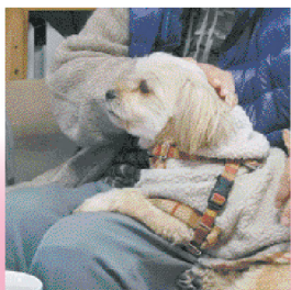
デイサービスで犬に癒される高齢者→

高齢者の見守りに関する民間事業者と市との協定締結の提案が実現→地域包括支援センターと密着した高齢者福祉の充実に力を注ぎます。