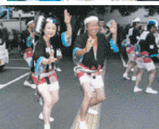
阿波踊り市役所連に毎年参加