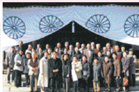
後援会でバス旅行