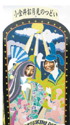
小金井お月見のつどいにて