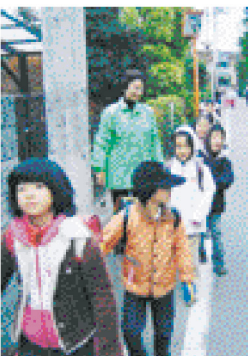
18年続けた登校時パトロール