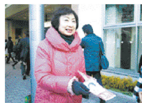
駅前でレポート配り