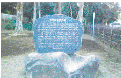
ご寄付をなさったの方々のお名前が表記された碑

緑地保全を目処に下弁天子供広場が12名の方々のご寄付により、管理を市がする事に→貫井神社境外社下弁財天との通路の整備と共に地域コミュニティの醸成を図ります。