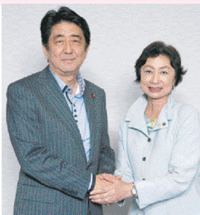
安倍晋三 総理大臣と