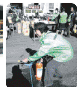
自治会、自主防災会の防災訓練