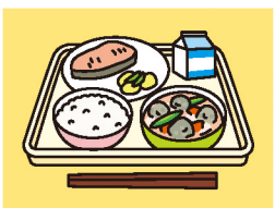
米飯給食の推進を

米飯給食の推進で全校に炊飯釜の整備を実現→地場野菜の導入拡大と共に、江戸東京野菜周知を含む食育学習の推進及び、都市農業の保全に力を注ぎます。