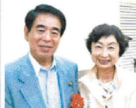
下村博文代議士と