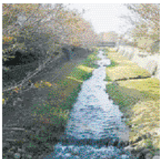
弁天橋から鞍尾根橋を望む

野川鞍尾根橋から弁天橋までの南岸6基・北岸7基の計13基の街路灯新設を実現→環境負荷軽減と経済効果の期待できる市内街路灯の全面LED化を目指します。